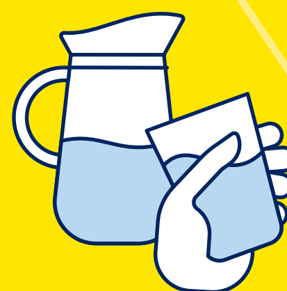
BUVEZ DE L'EAU