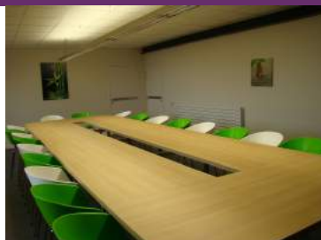
© Salle du pont aux chèvres

Contact : 06 07 46 30 97 gerard.basselot@wanadoo.fr