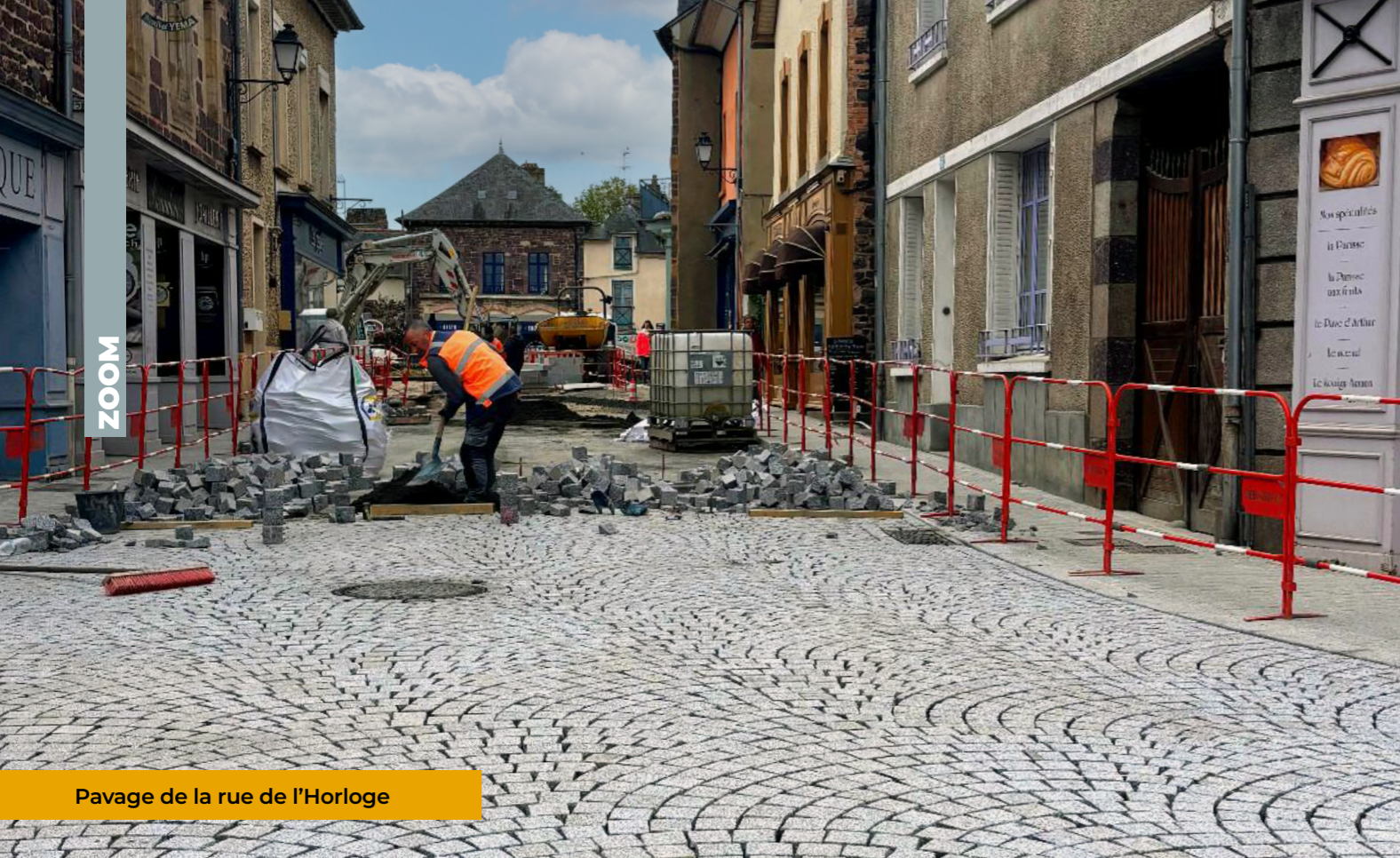
Pavage de la rue de l'Horloge