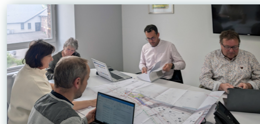
Les élus au travail sur les projets d'aménagement de votre centre-ville.

Dès le forum des associations de la rentrée 2026, de premières tables rondes de la vie associative seront organisées pour mieux coordonner les besoins et favoriser les coopérations.