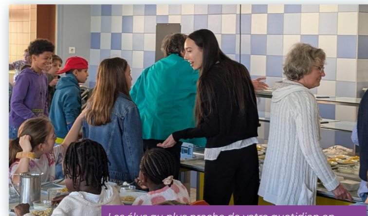
Les élus au plus proche de votre quotidien en immersion à la restauration scolaire.

Face au changement climatique, la Ville lancera un programme d'adaptation ambitieux.