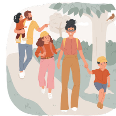
La forêt de Saint-Lazare - Montfort-sur-Meu

Et si prendre soin de sa santé passait simplement par... sortir dehors ? De plus en plus d'études scientifiques le confirment : passer du temps dans la nature a des effets bénéfiques importants sur notre bien-être physique et mental.